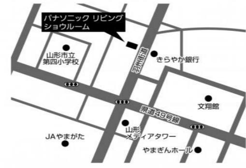
パナソニックリビングショールーム山形